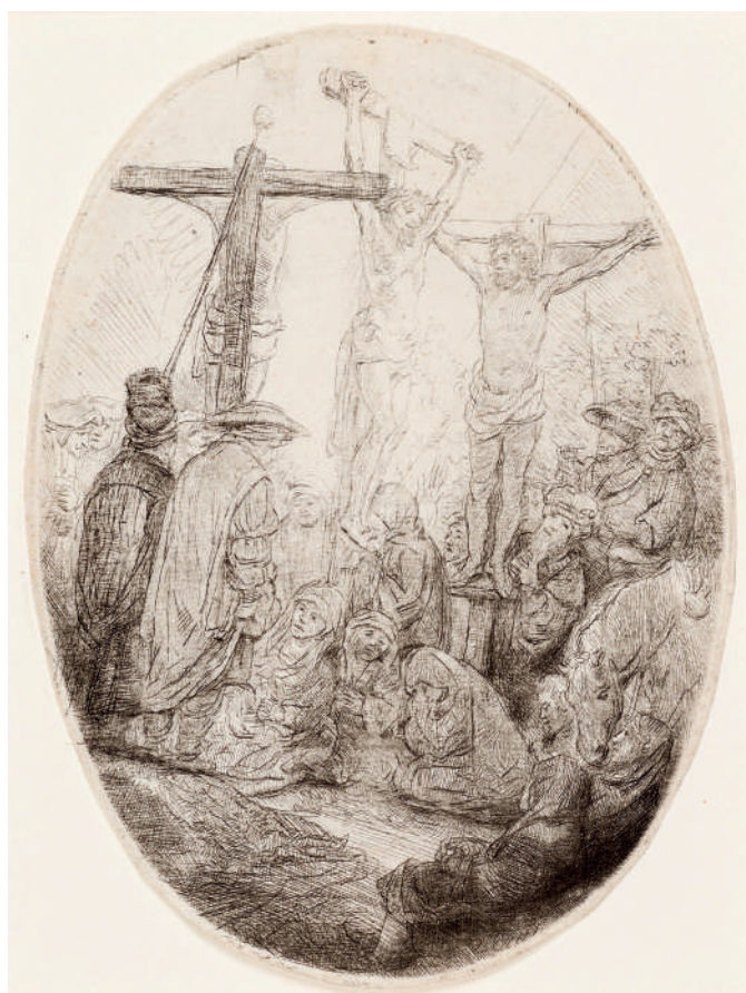
Cristo Crucificado entre Dois Ladrões // 1641 Água-forte e ponta-seca.