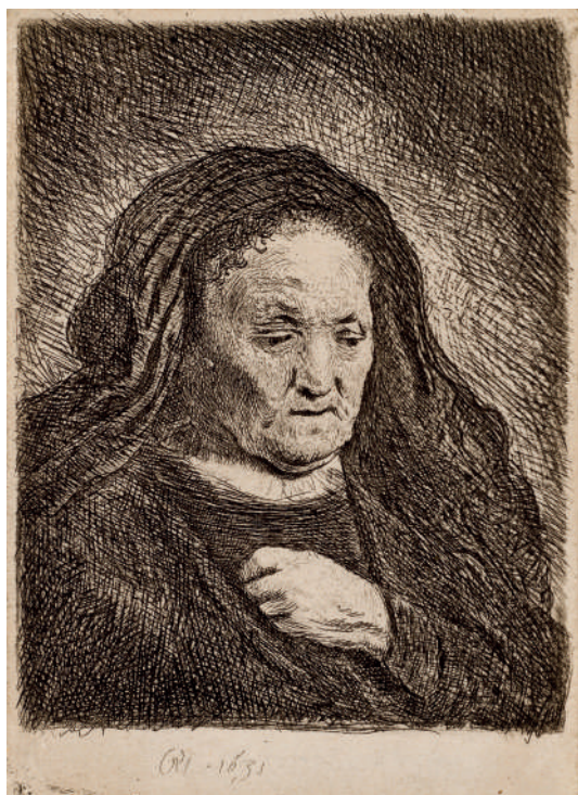
Mãe do Artista com a Mão no Peito // 1631 Água-forte.