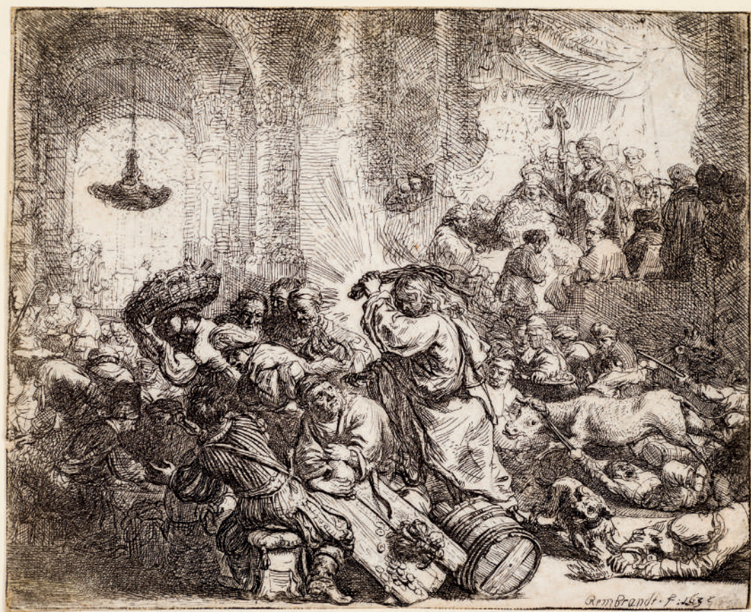
Cristo Expulsando os Cambistas do Templo // 1635 Água-forte e ponta-seca.