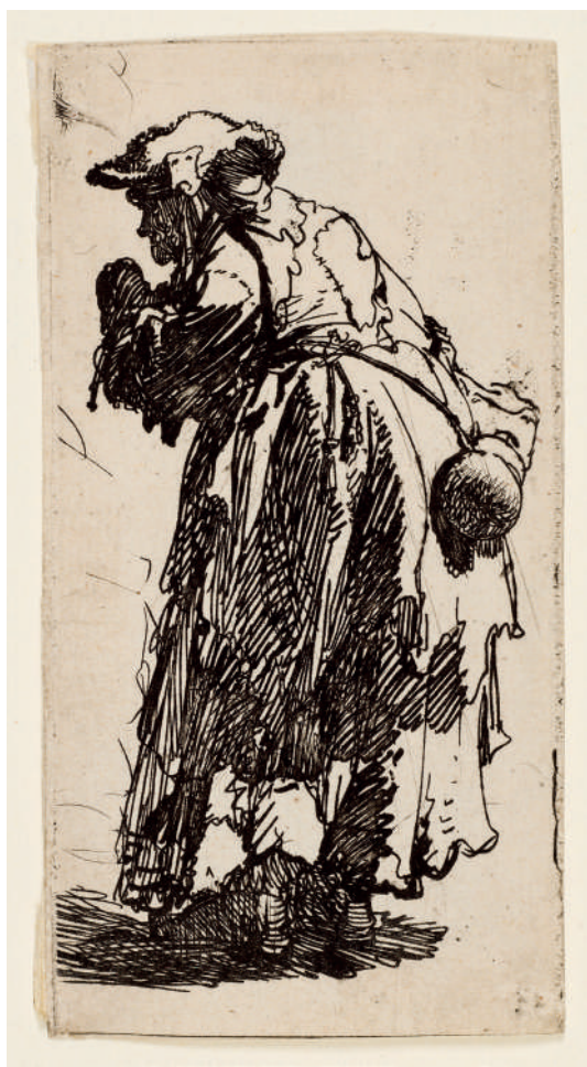
Velha Mendiga com uma Cabaça // 1630 Água-forte.