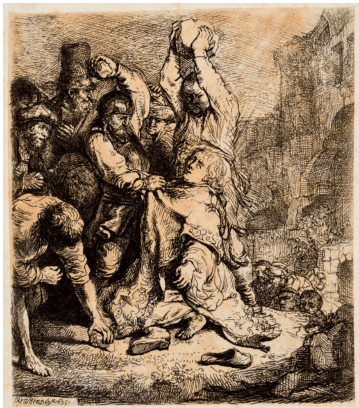
O Apedrejamento de Santo Estêvão // 1635 Água-forte.