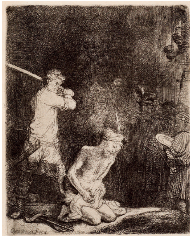
A Decapitação de João Batista // 1640 Água-forte e ponta-seca.