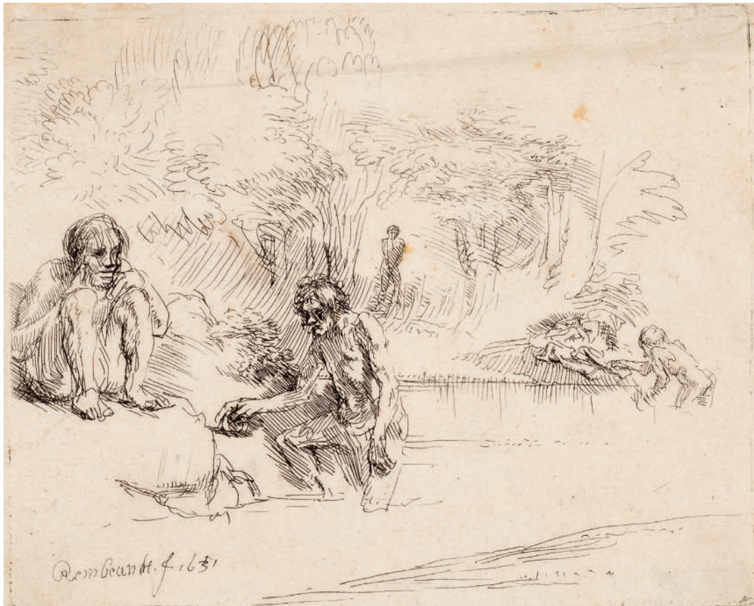
Os Banhistas // 1651 Água-forte.