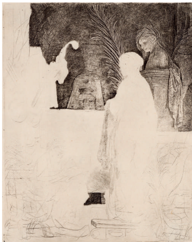
O Artista Desenhando a Partir do Modelo // 1639 Água-forte, ponta-seca e buril.