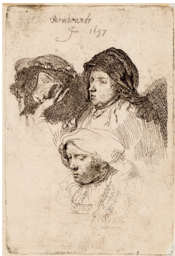
Três Cabeças de Mulheres, uma Dormindo // 1637 Água-forte.