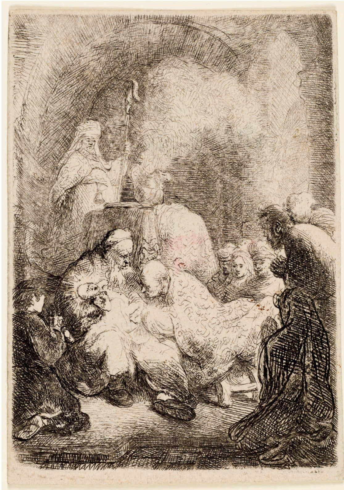
A Circuncisão // 1630 Água-forte e ponta-seca.