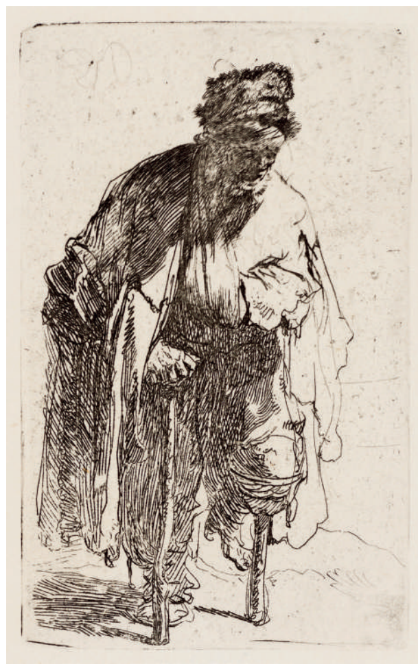
Mendigo com uma Perna de Pau // 1630 Água-forte.