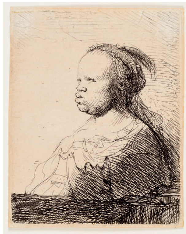
A Negra Branca // 1630 Água-forte.