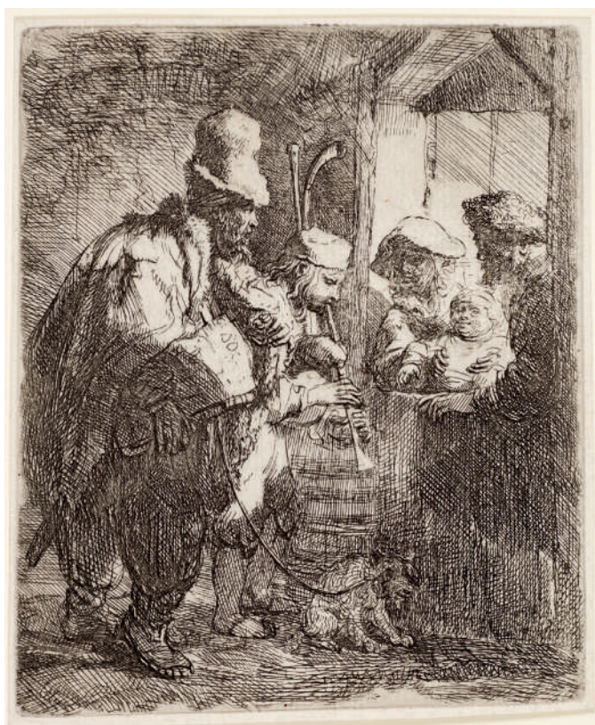
Os Músicos Ambulantes // 1635 Água-forte.