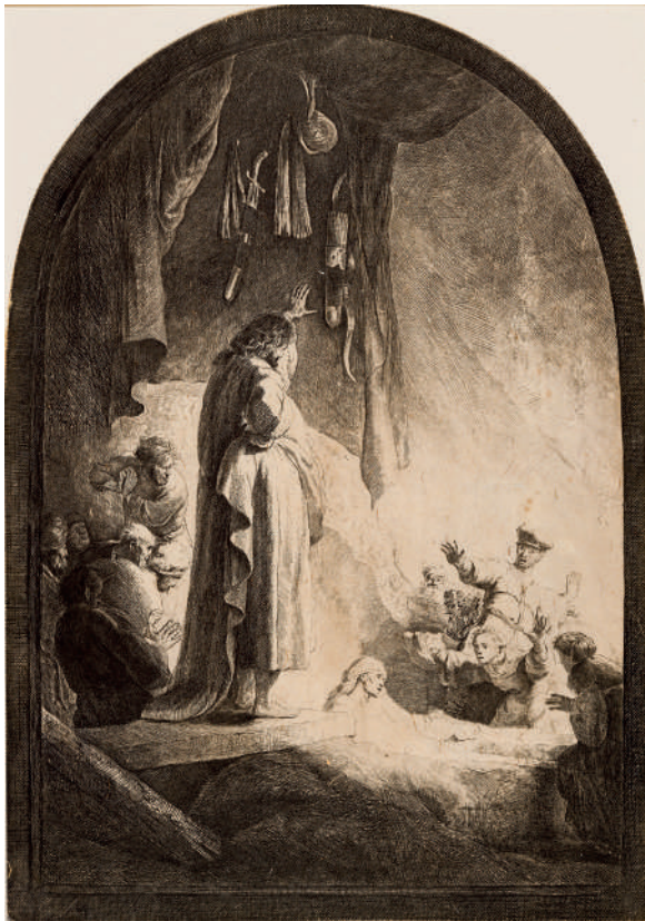
A Ressurreição de Lázaro: placa grande // 1632 Água-forte e buril.