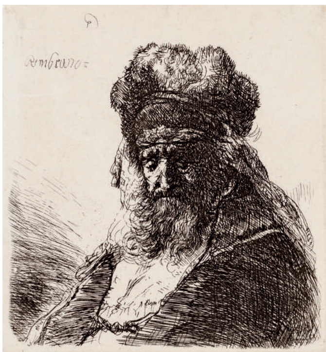
Velho Barbudo com Chapéu de Pele Alto, com Olhos Fechados // 1630 Água-forte.