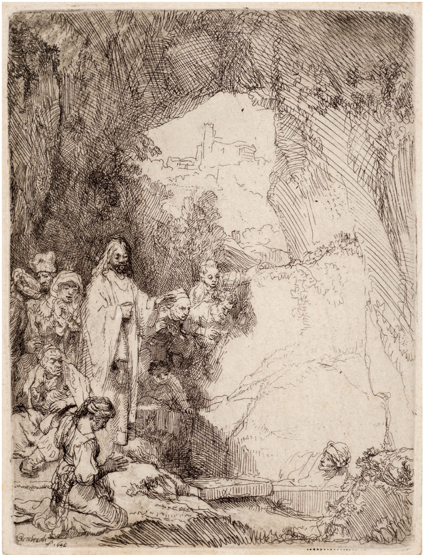
A Ressurreição de Lázaro: placa pequena // 1642 Água-forte.