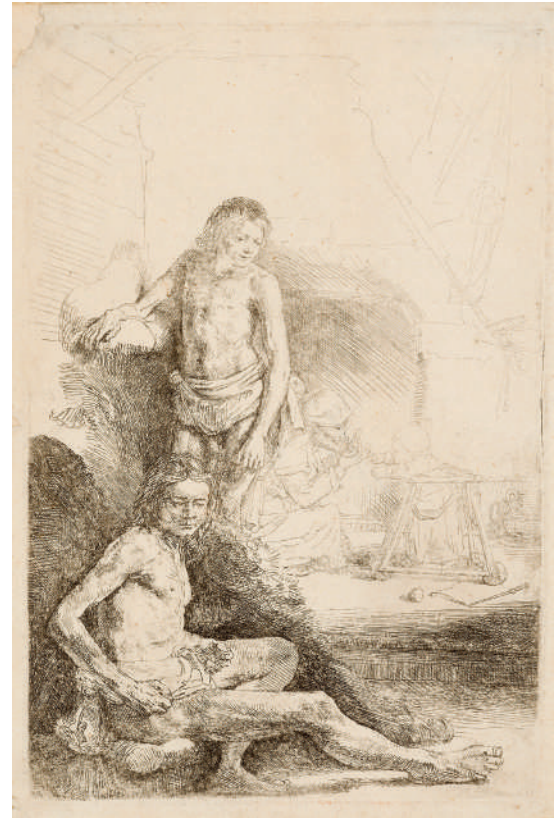
Jovem Sentado e em Pé // 1646 Água-forte.