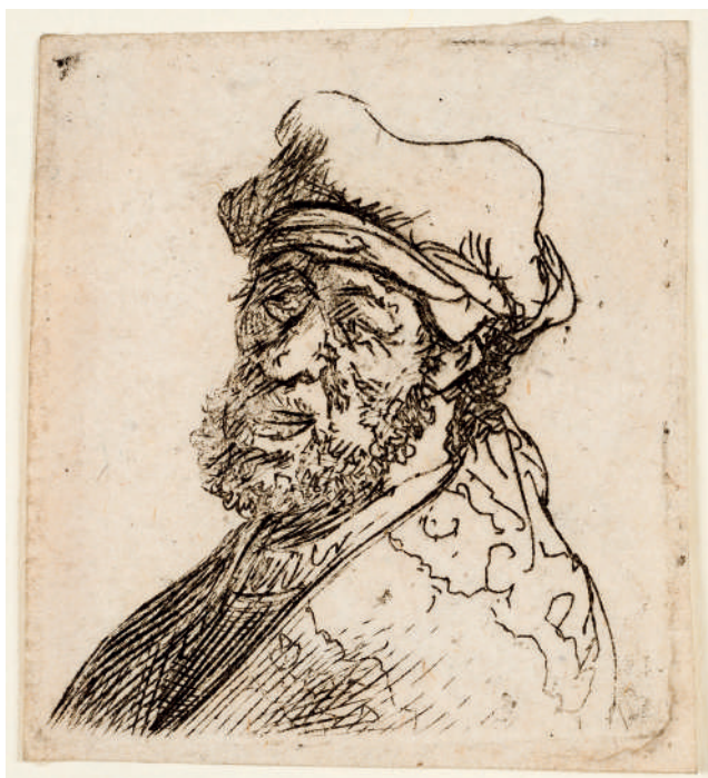
Homem Gritando // 1631 Água-forte.