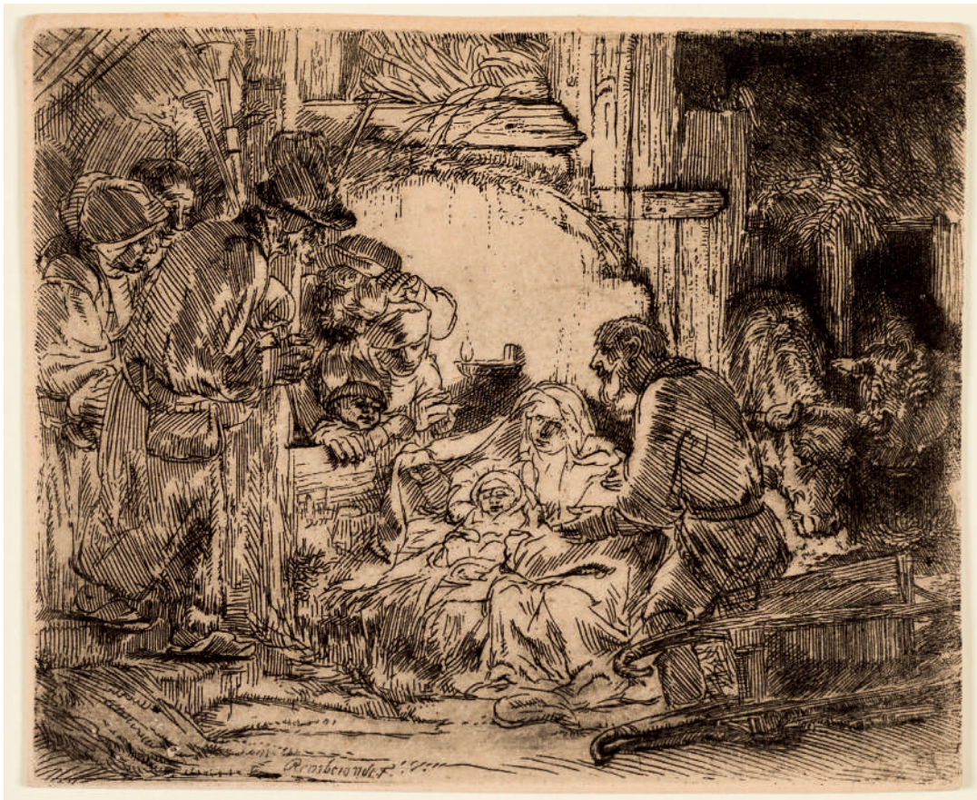
A Adoração dos Pastores: com a Lâmpada // 1654 Água-forte.