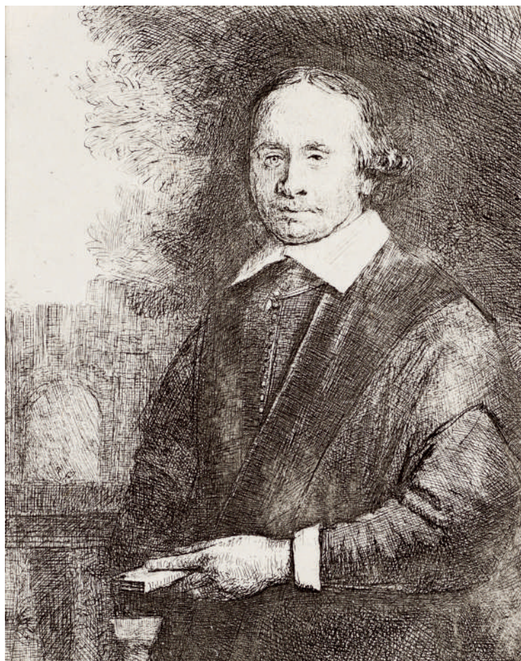
Jan Antonides van der Linden // 1665 Água-forte, ponta-seca e buril.