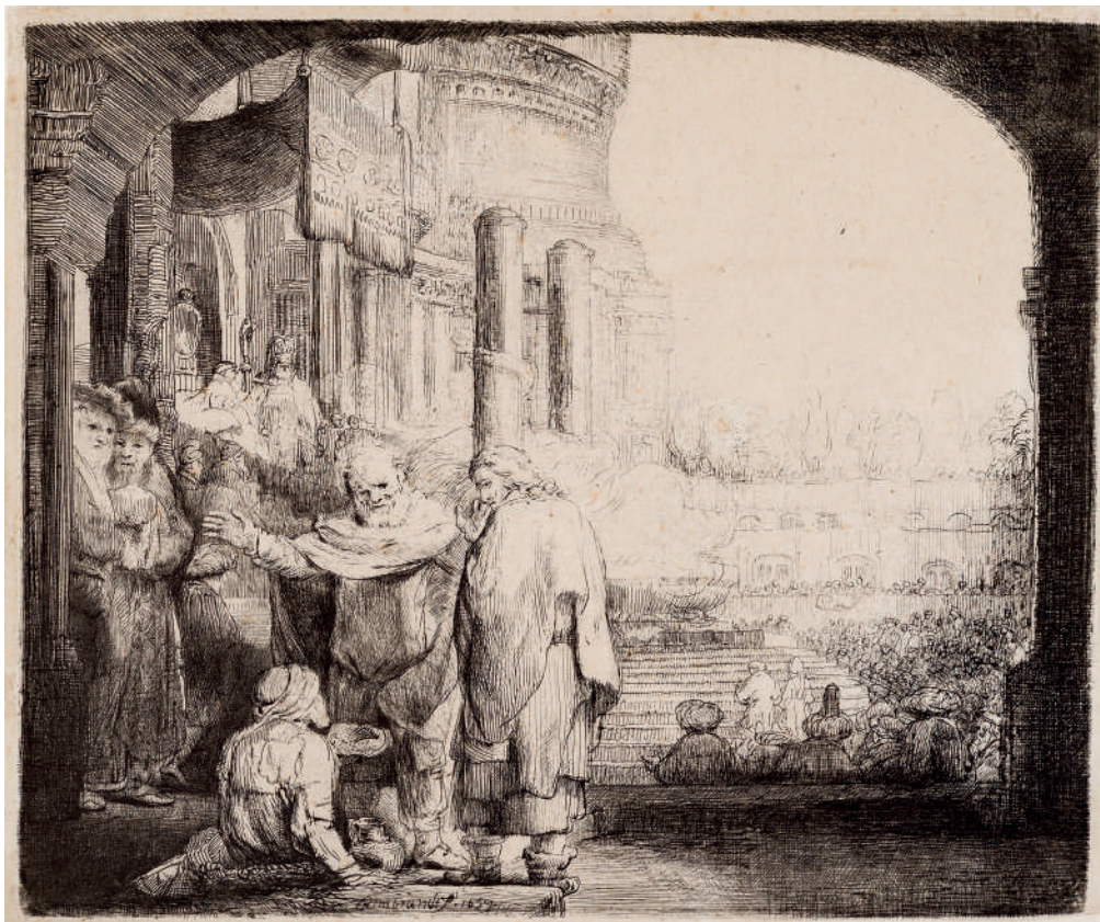
Pedro e João Curando o Coxo à Porta do Templo // 1659 Água-forte, ponta-seca e buril.