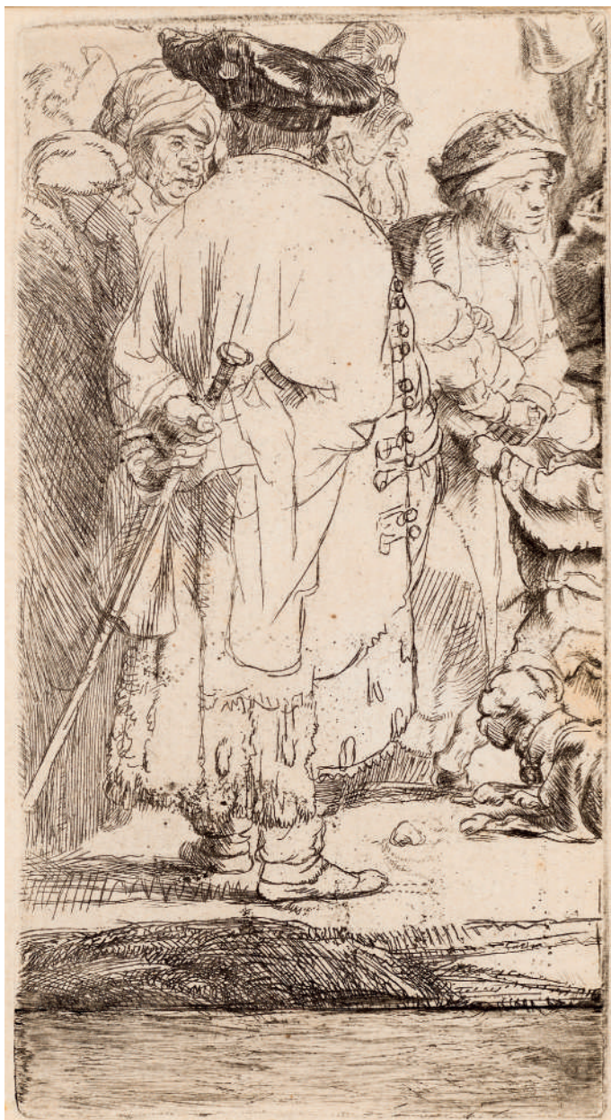
A Impressão dos Cem Florins (parcial) // 1649 Água-forte e ponta-seca.