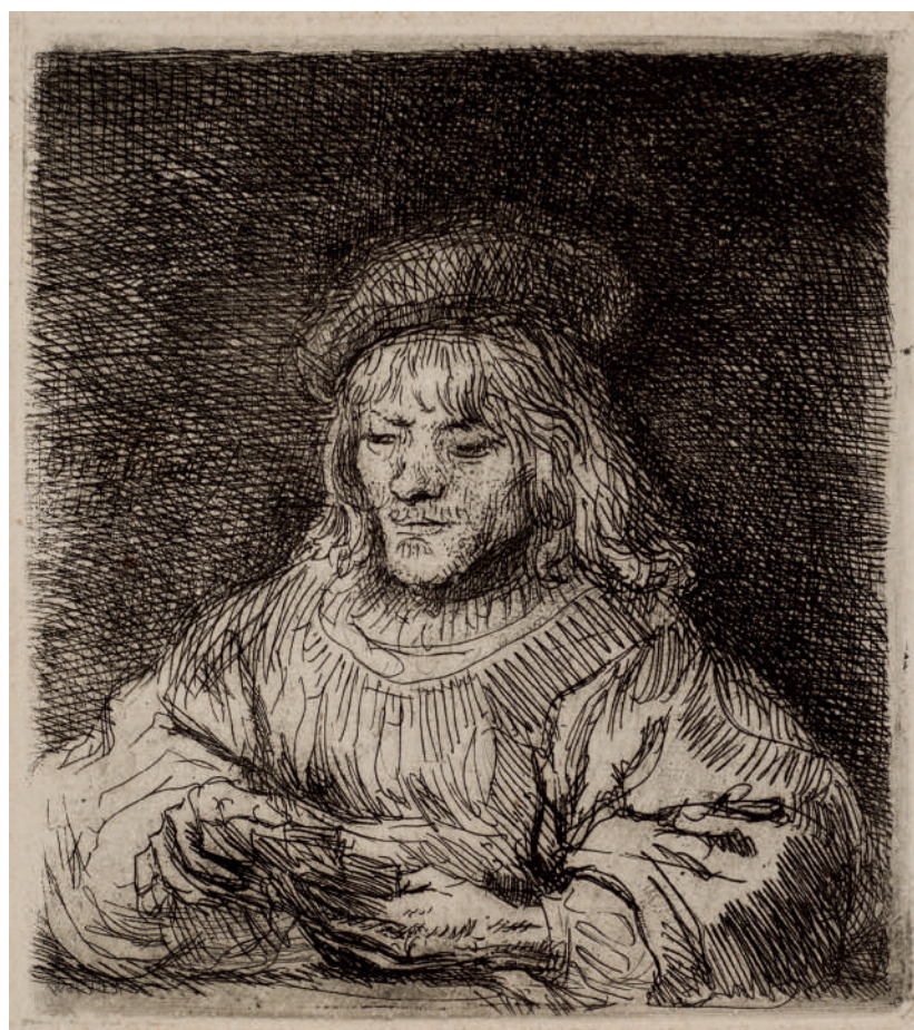
O Jogador de Cartas // 1641 Água-forte.