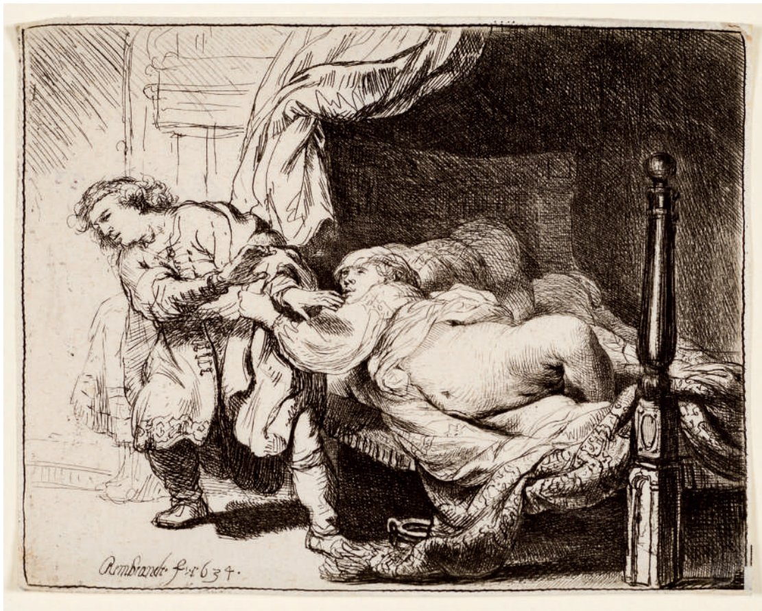
José e a Mulher de Potifar // 1634 Água-forte.