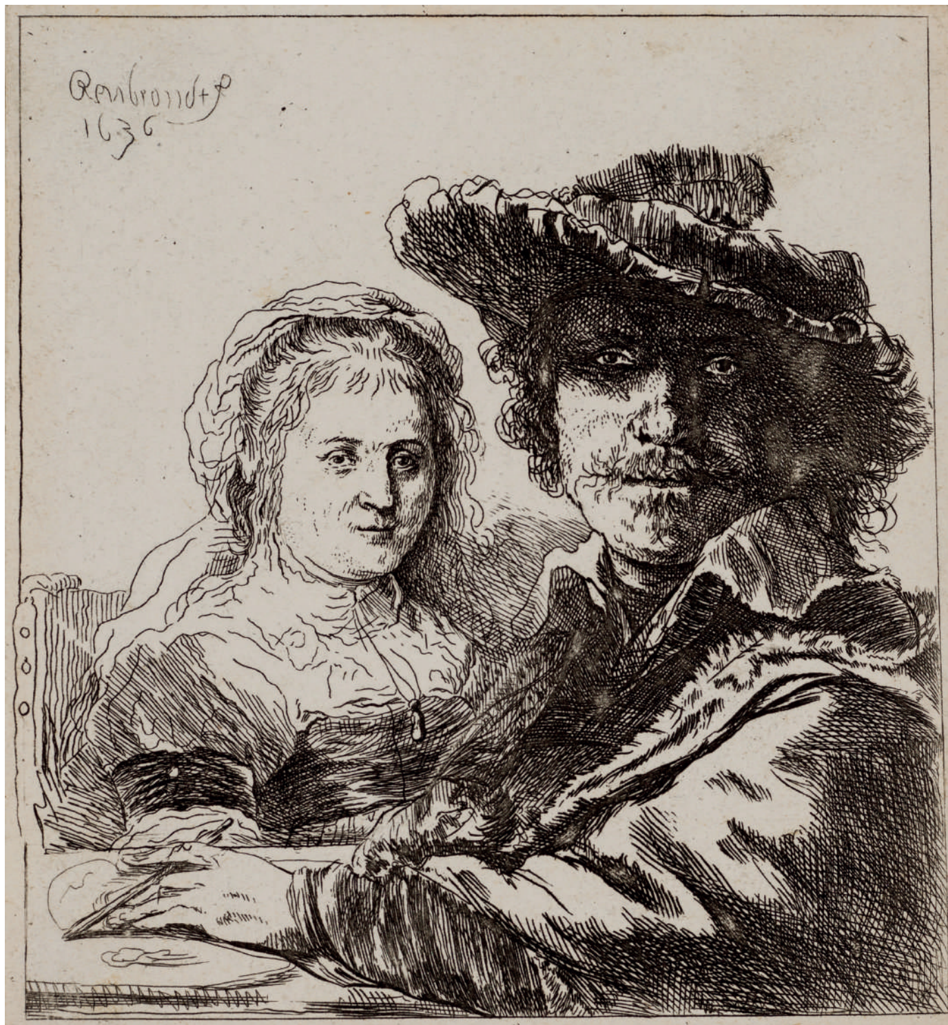
Autorretrato com Saskia // 1636 Água-forte.