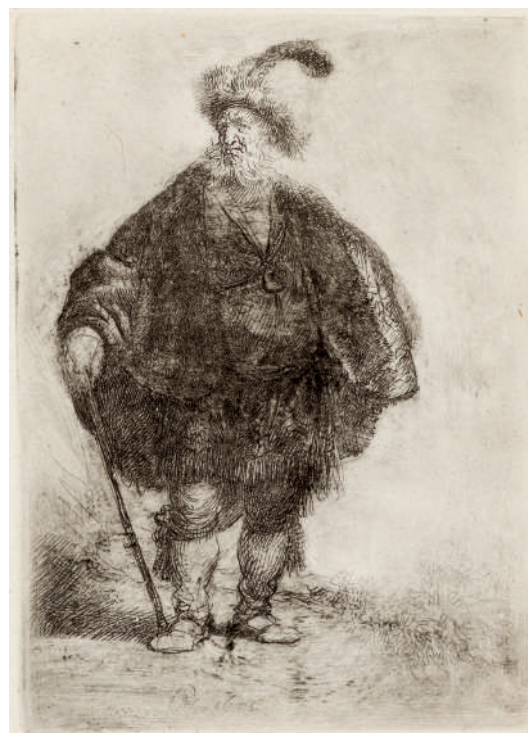
O Persa // 1632 Água-forte.