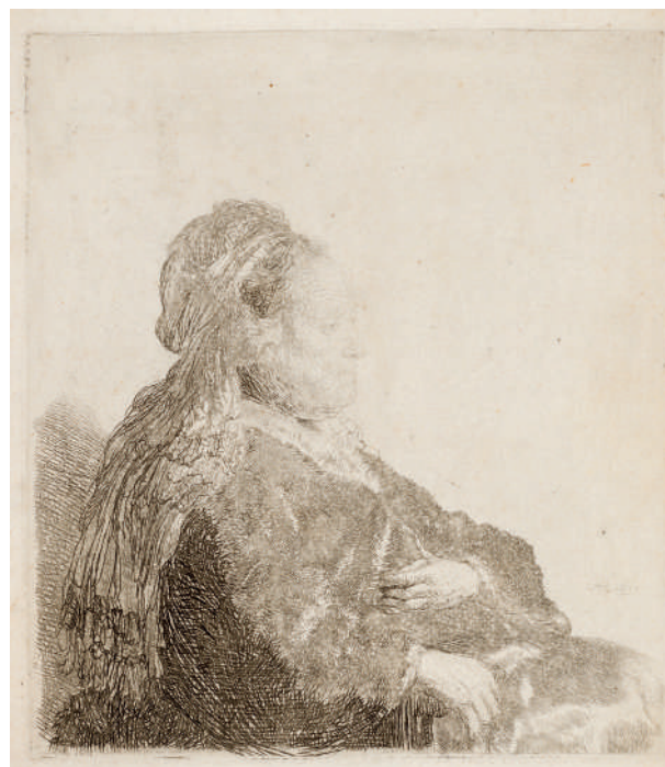
Mãe do Artista Sentada, com Touca Oriental (meio corpo) // 1631 Água-forte.