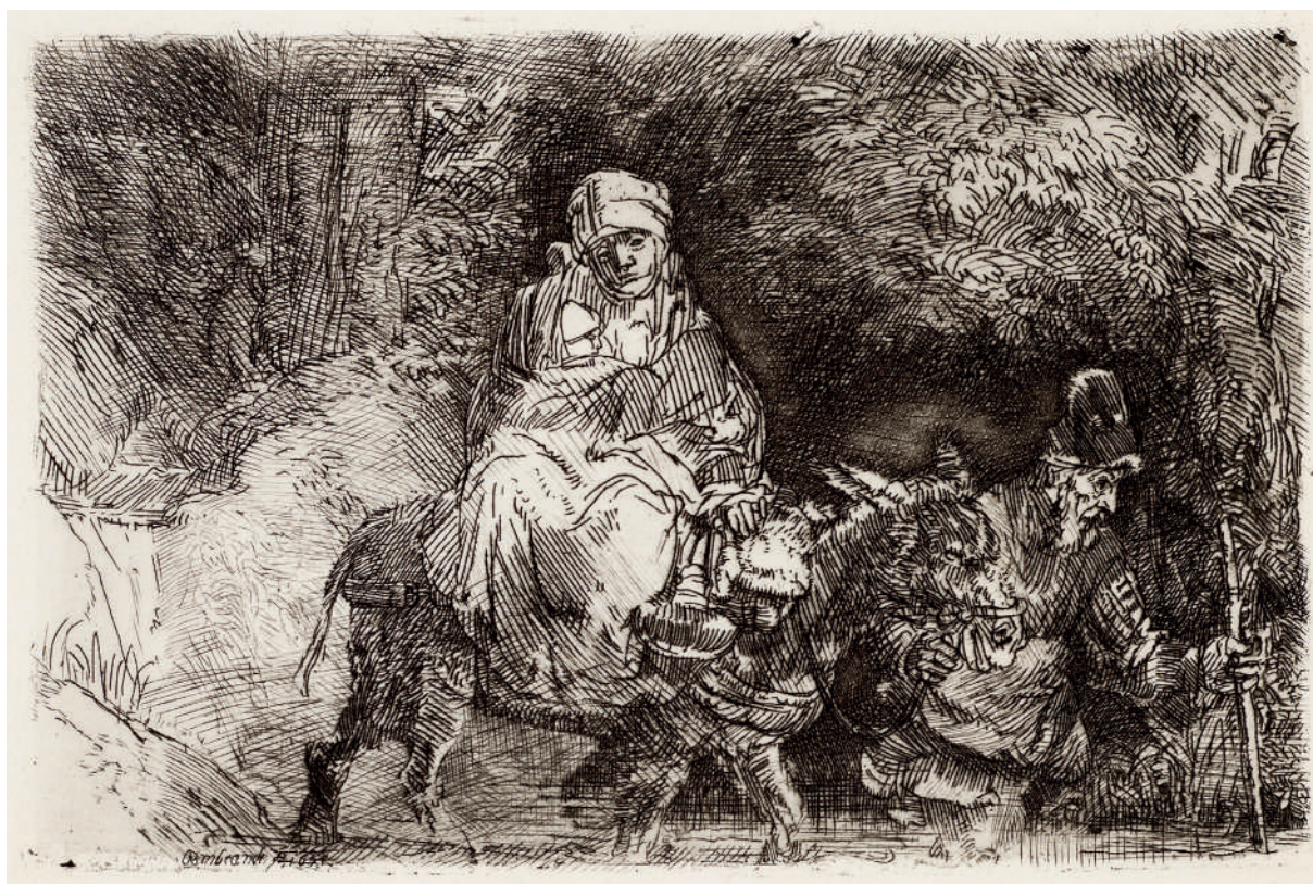
A Fuga para o Egito: atravessando um riacho // 1654 Água-forte e ponta-seca.