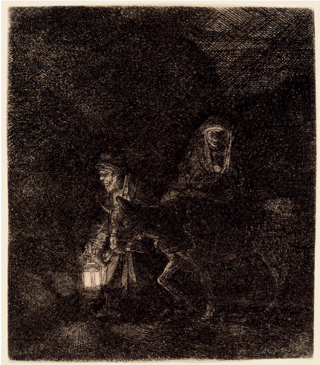
A Fuga para o Egito: cena noturna // 1651 Água-forte e ponta-seca.