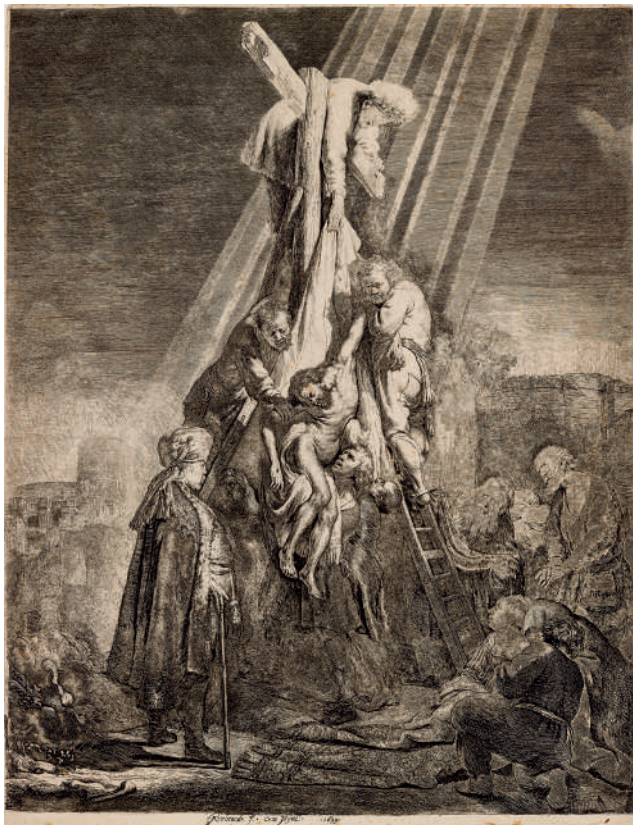
A Descida da Cruz // 1633 Água-forte e buril.