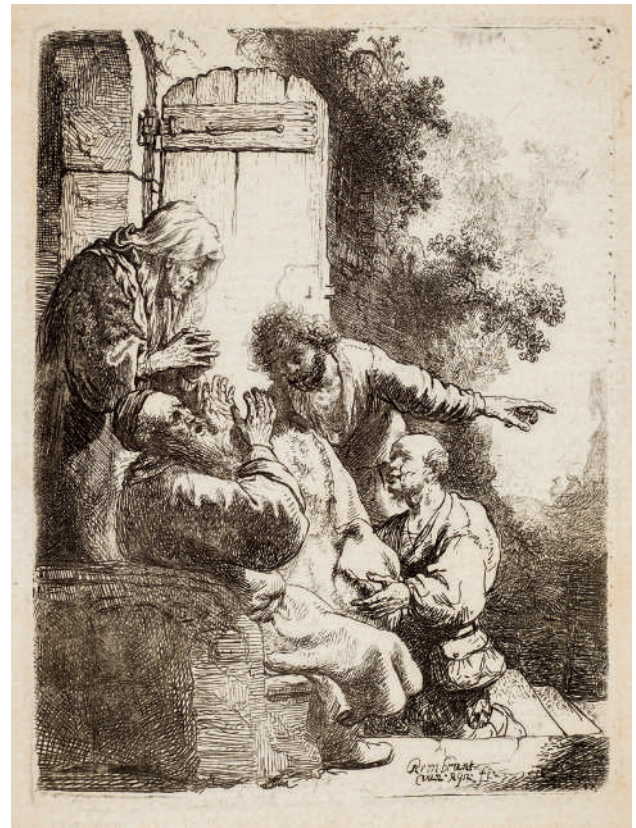
O Manto de José Trazido a Jacó // 1633 Água-forte e ponta-seca.