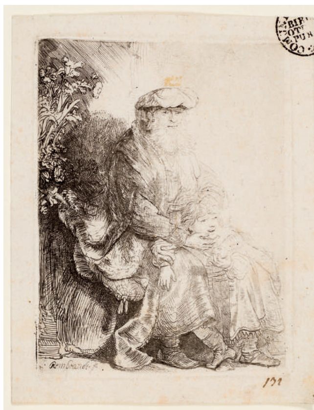
Abraão Acariciando Isaque // 1637 Água-forte.