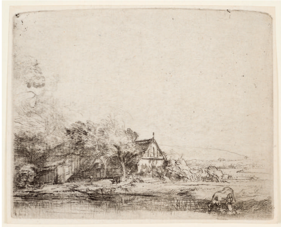
Paisagem com uma Vaca // 1650 Água-forte e ponta-seca.