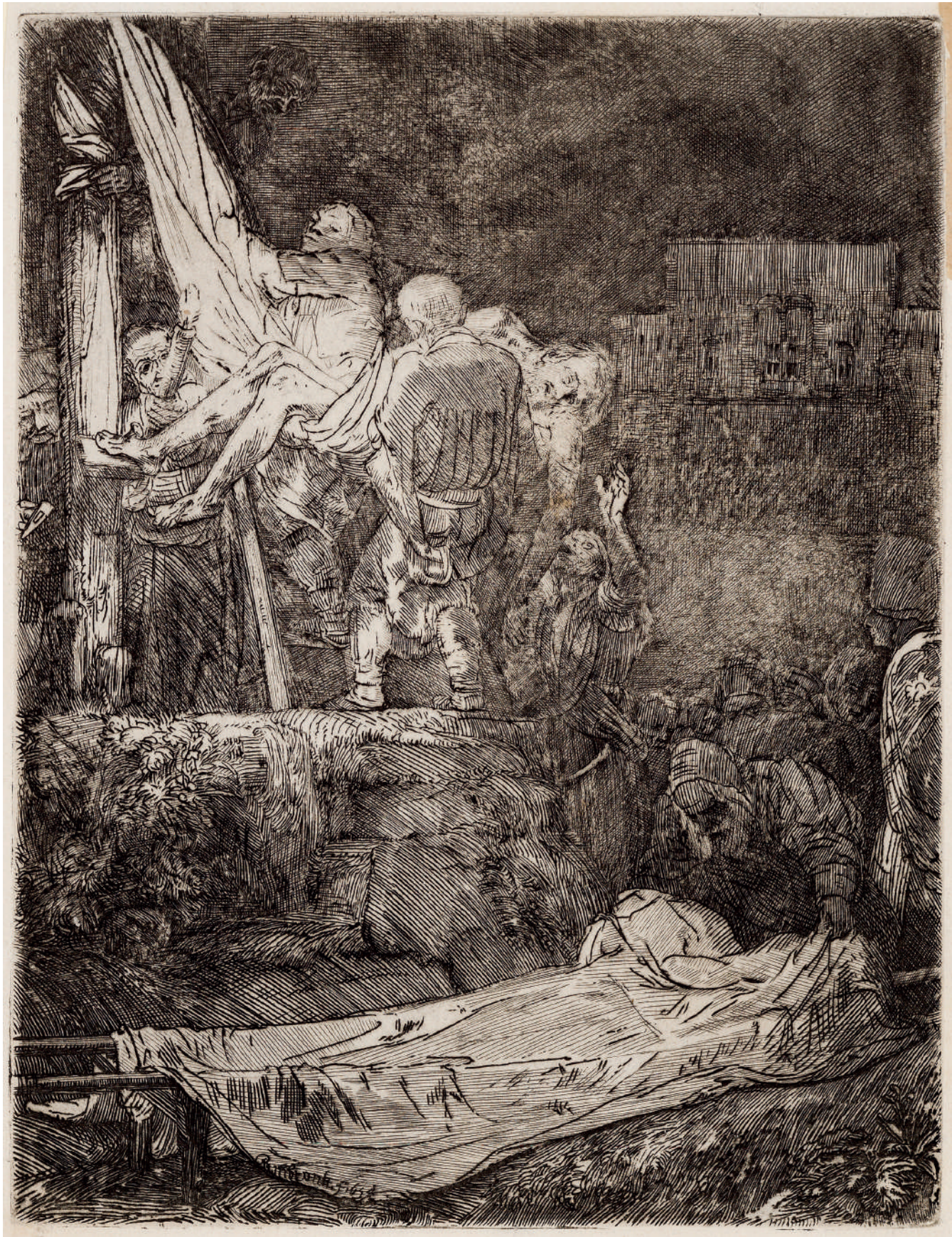
A Descida da Cruz à Luz de Tochas // 1654 Água-forte e ponta-seca.