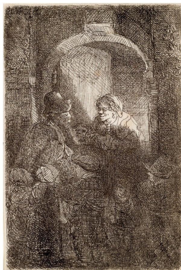
Mulher na Porta Conversando com um Homem e Crianças // 1641 Água-forte.