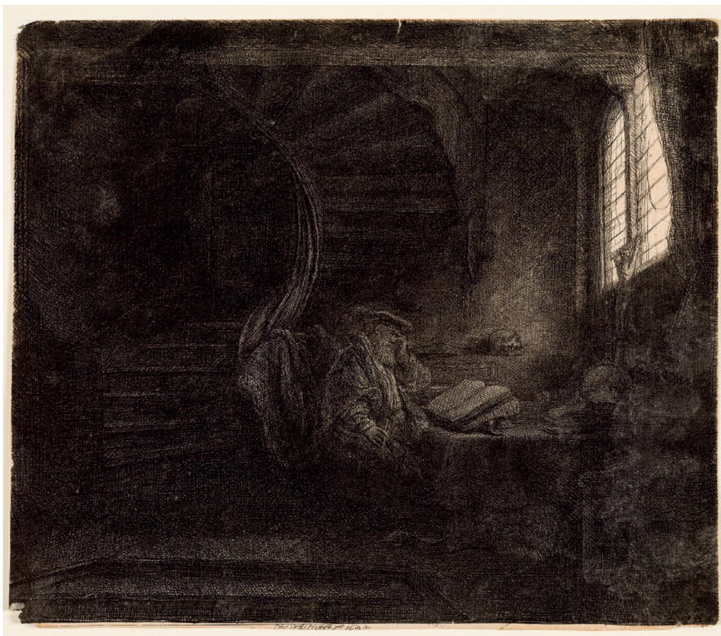
São Jerônimo em um Quarto Escuro // 1642 Água-forte.