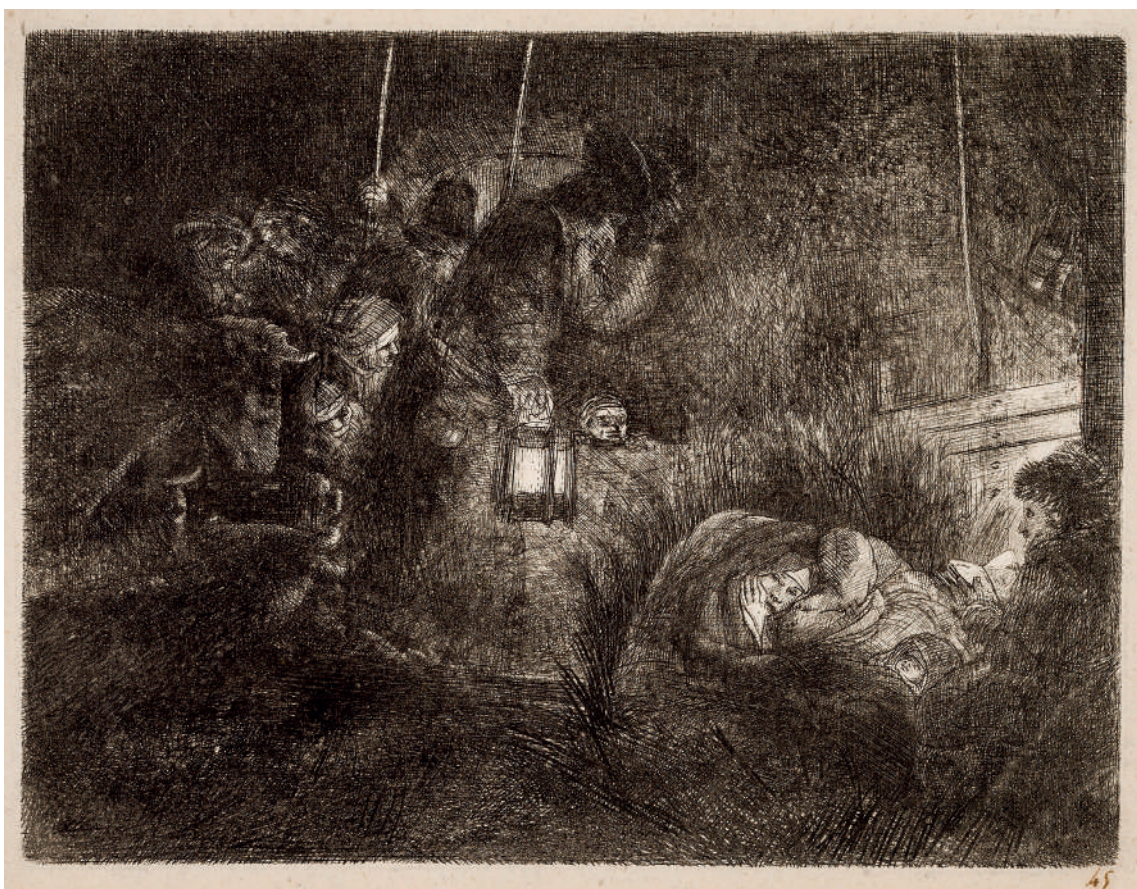
A Adoração dos Pastores: cena noturna // 1652 Água-forte e ponta-seca.