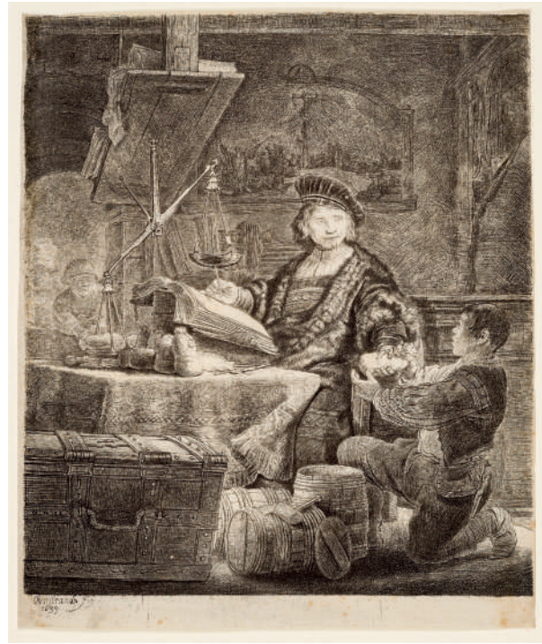
Jan Uytenbogaert, o Pesador de Ouro // 1639 Água-forte e ponta-seca.