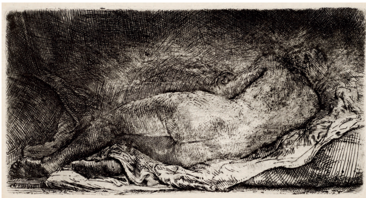
Mulher Negra Deitada // 1658 Água-forte, ponta-seca e buril.