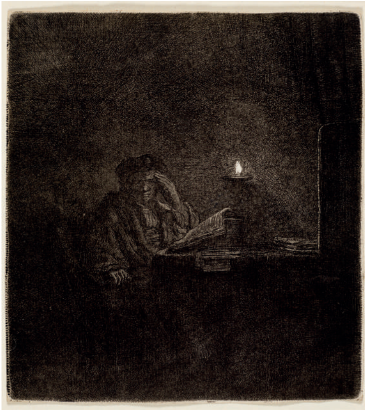
Estudante à Mesa à Luz de Velas // 1642 Água-forte.