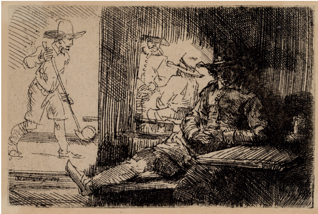
O Jogador de Golfe // 1654 Água-forte.