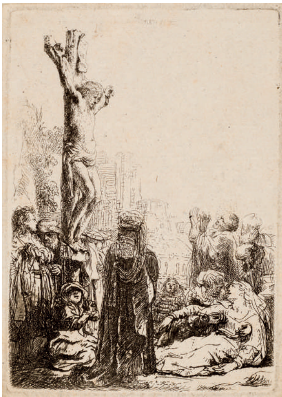
A Crucificação // 1635 Água-forte.