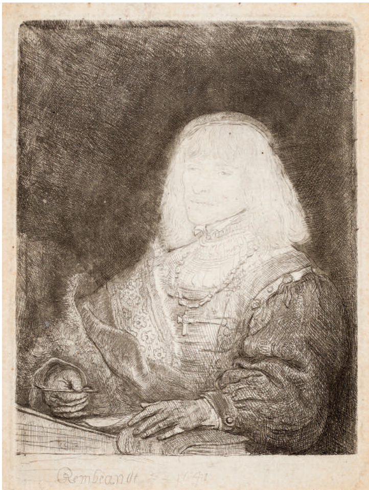
Homem à Escrivaninha com Cruz e Corrente // 1641 Água-forte e ponta-seca.