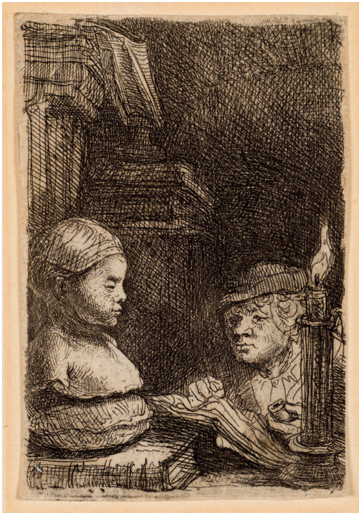
Homem Desenhando a Partir de um Modelo em Gesso // 1641 Água-forte.