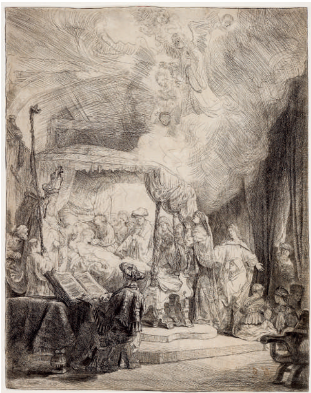
A Morte da Virgem // 1639 Água-forte e ponta-seca.