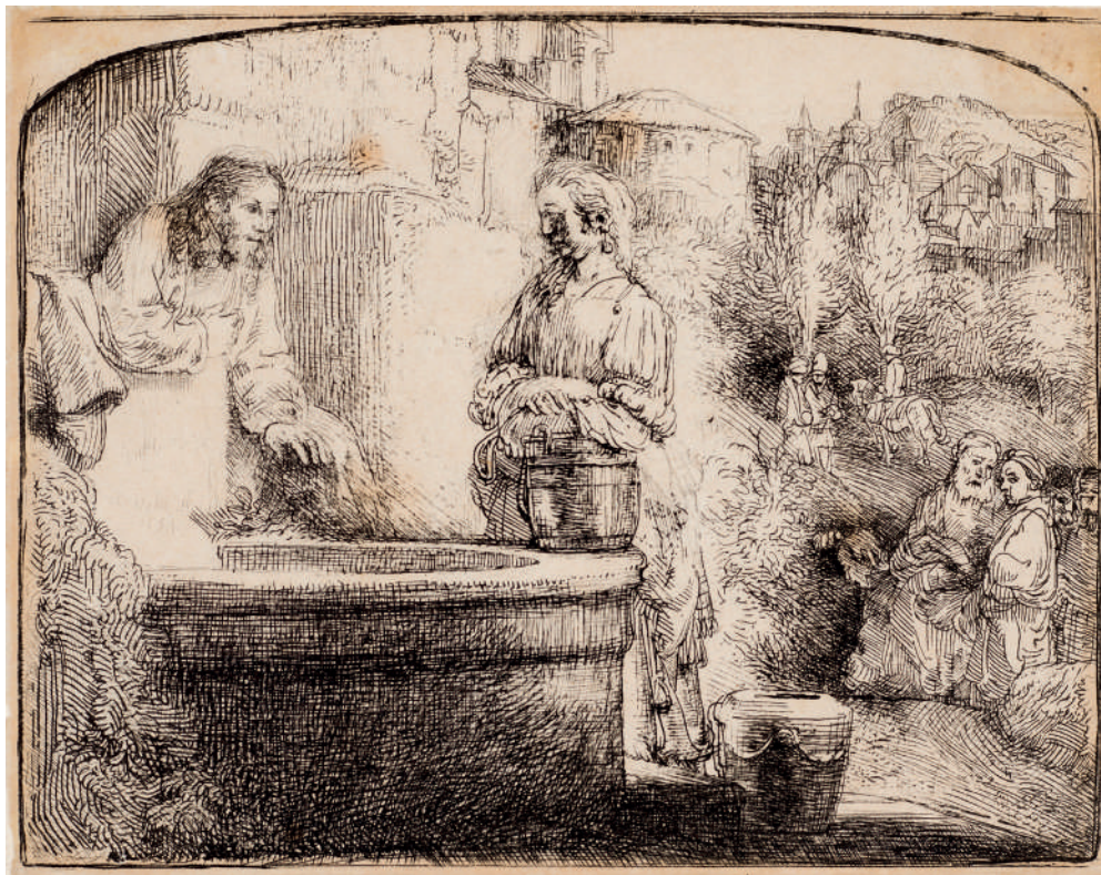
Cristo e a Mulher Samaritana // 1658 Água-forte e ponta-seca.