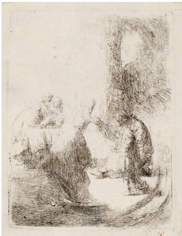
Cristo Discutindo com os Doutores (placa pequena) // 1630 Água-forte.