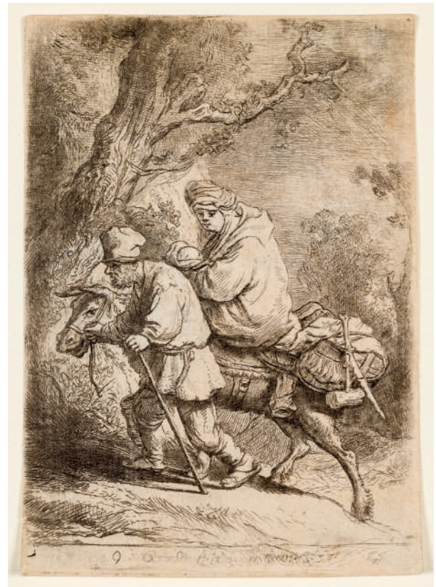
A Fuga para o Egito // 1633 Água-forte.