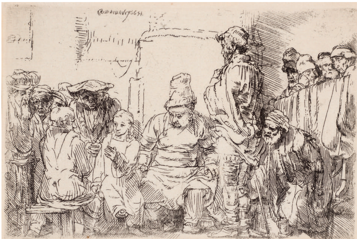
Cristo Sentado Discutindo com os Doutores // 1654 Água-forte.