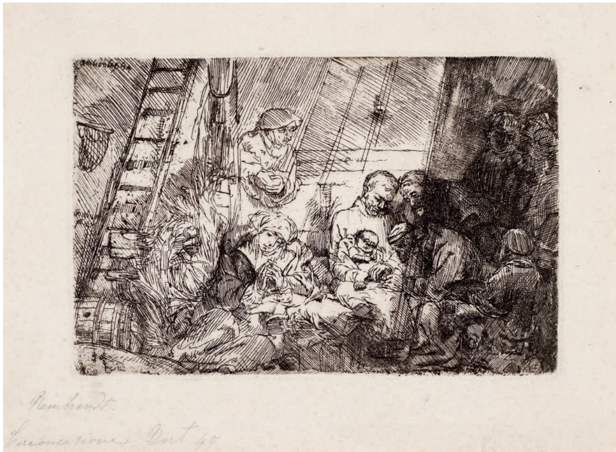
A Circuncisão no Estábulo // 1654 Água-forte.