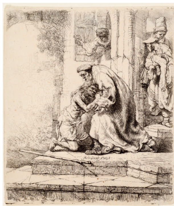
O Retorno do Filho Pródigo // 1636 Água-forte.