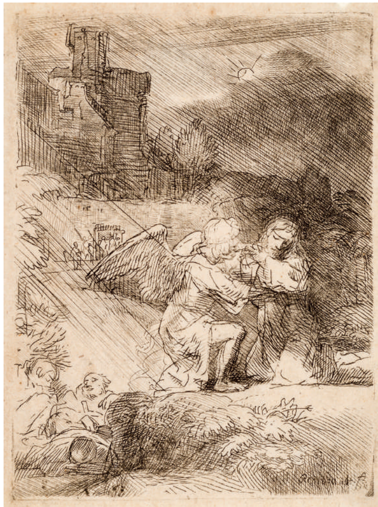
A Agonia no Jardim // 1657 Água-forte e ponta-seca.