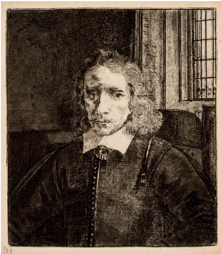
O Jovem Haring // 1655 Água-forte.