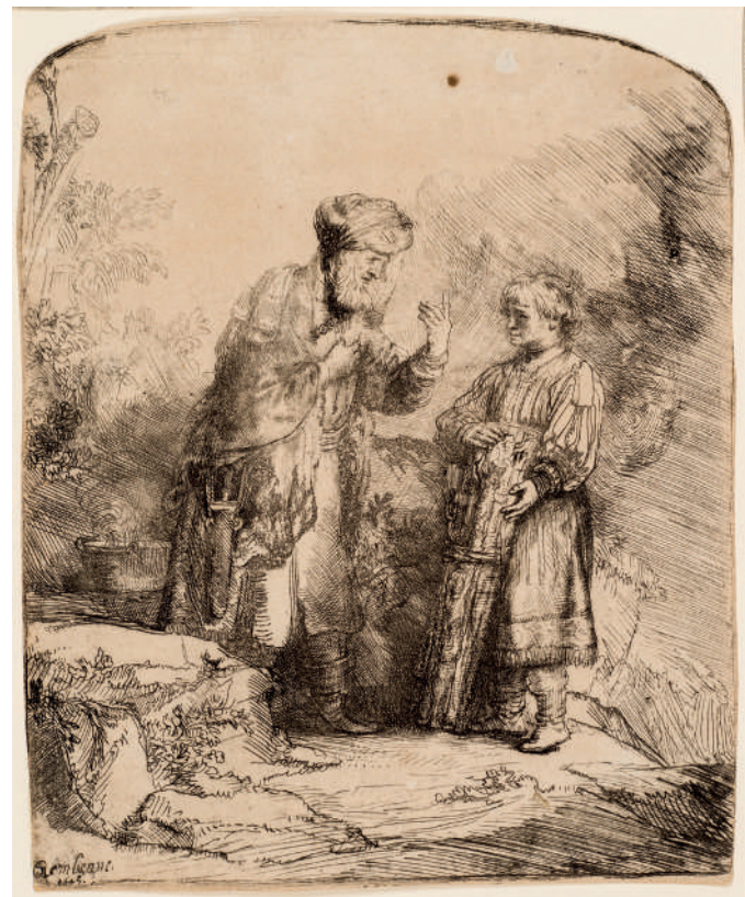
Abraão e Isaque // 1645 Água-forte e buril.