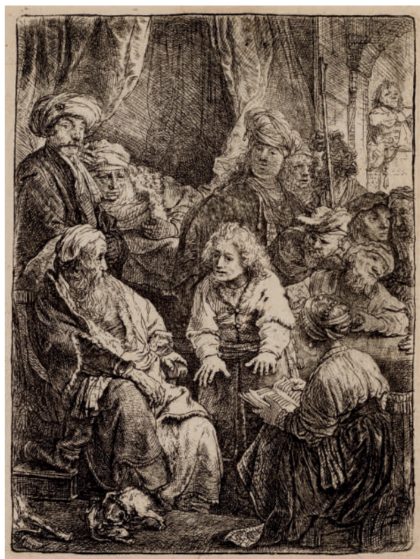
José Contando Seus Sonhos // 1638 Água-forte.