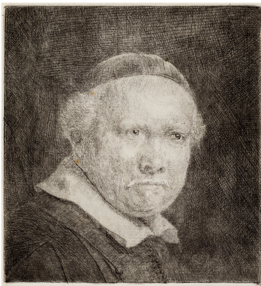
Lieven Willemsz van Coppenol, Mestre de Caligrafia // 1658 Água-forte, ponta-seca e buril.