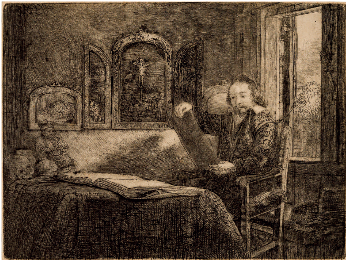
Abraham Francen, Boticário // 1657 Água-forte e ponta-seca.