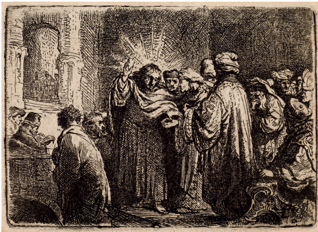
O Dinheiro do Tributo // 1635 Água-forte.