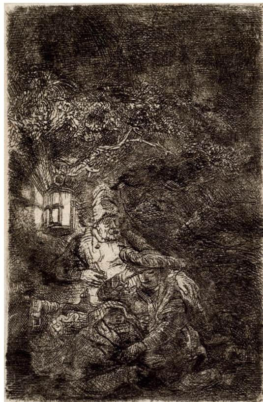
O Descanso na Fuga: cena noturna // 1644 Água-forte e ponta-seca.