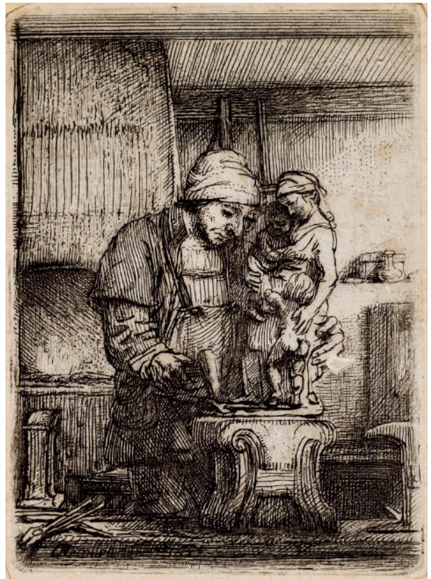
O Ourives // 1655 Água-forte e ponta-seca.