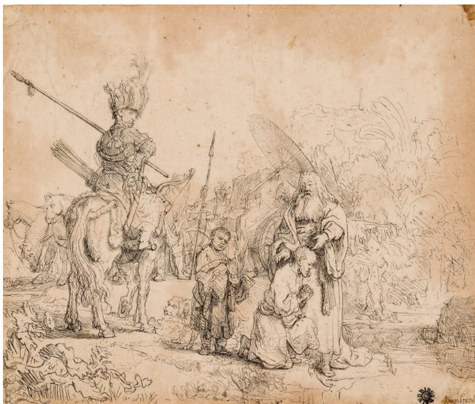
O Batismo do Eunuco // 1641 Água-forte.