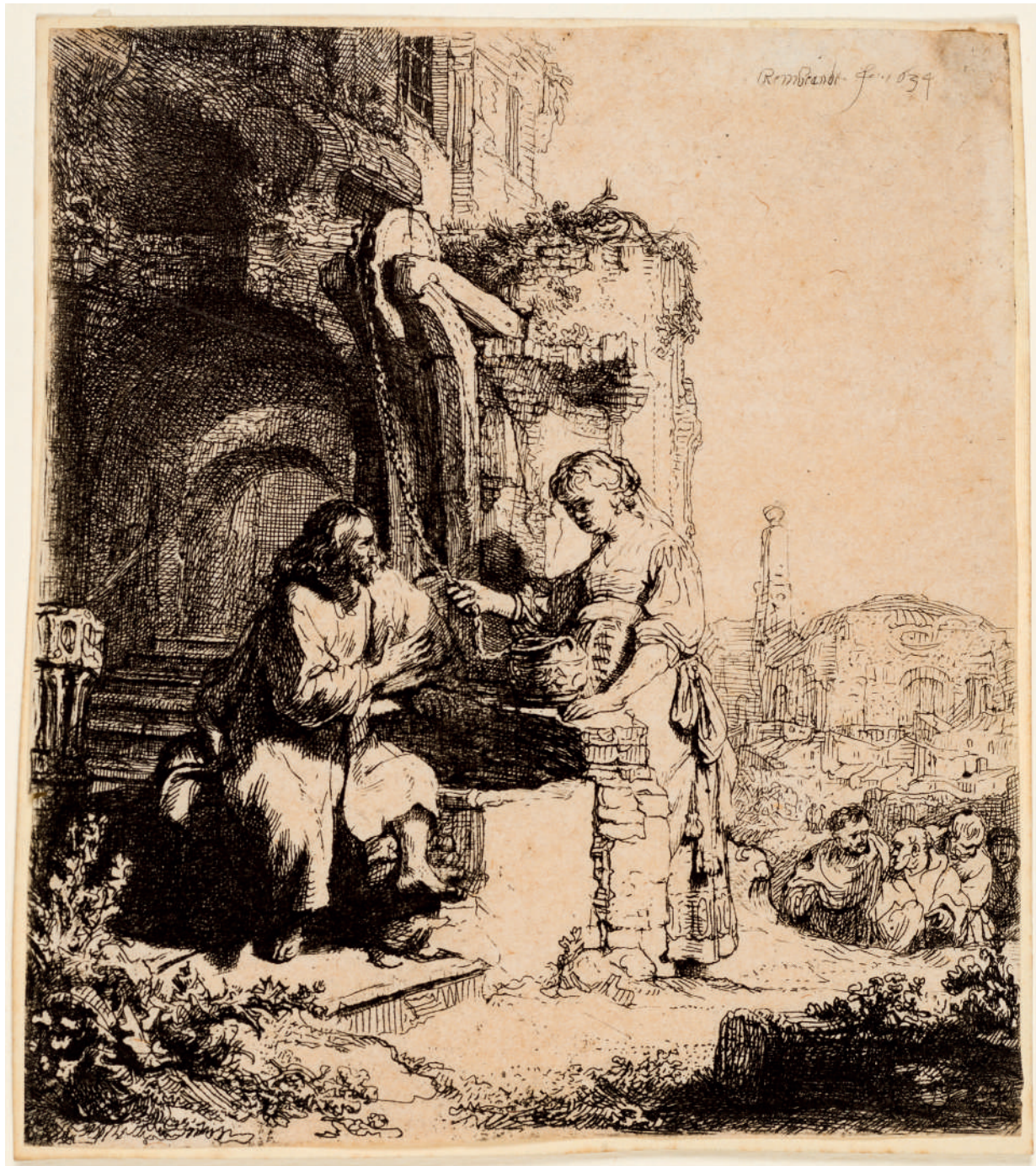
Cristo e a Mulher Samaritana: entre ruínas // 1634 Água-forte.