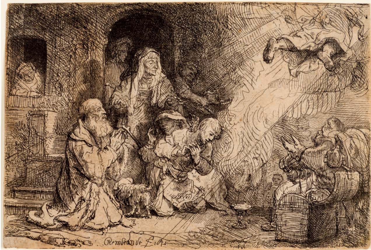
O Anjo Partindo da Família de Tobias // 1641 Água-forte e ponta-seca.