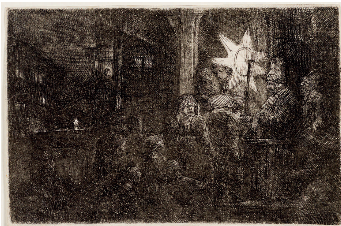
A Estrela dos Reis: cena noturna // 1651 Água-forte, ponta-seca e buril.