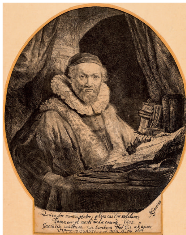
Jan Uytenbogaert, Pregador dos Remonstrantes // 1635 Água-forte e ponta-seca.