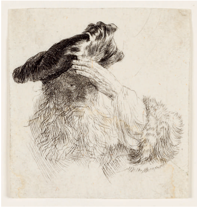
Velho Sombreado os Olhos com a Mão // 1639 Água-forte e ponta-seca.